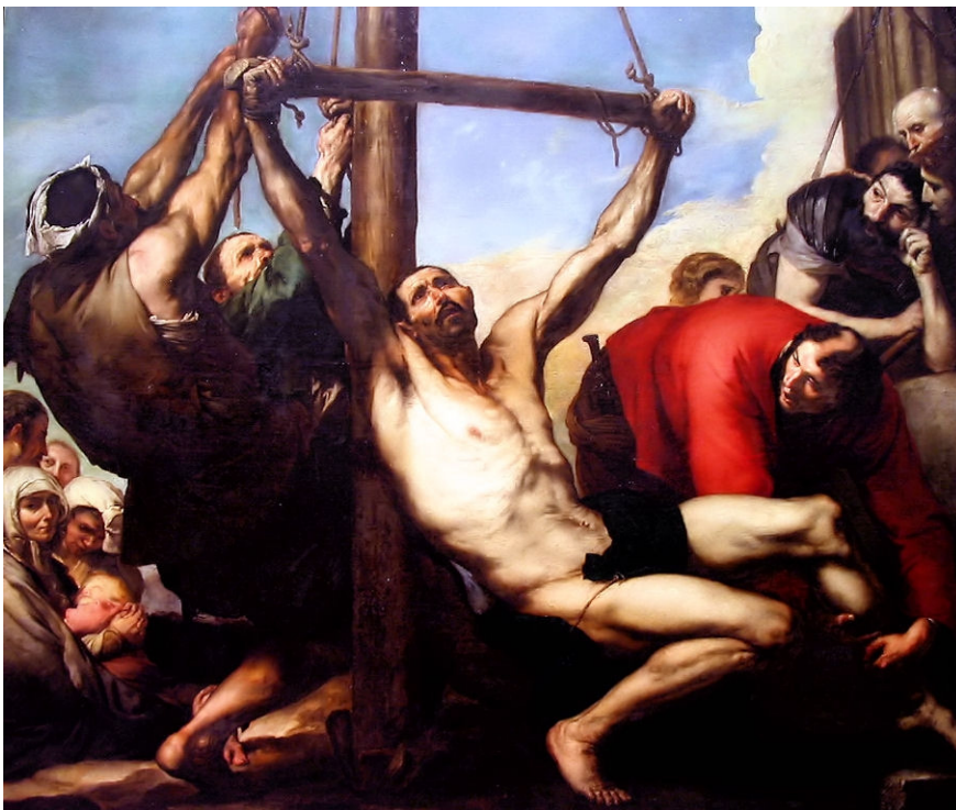
Imagen 2: El martirio de San Felipe. 1639. José Ribera.

Imatge 2. El martiri de Sant Felip. 1639. José Ribera.