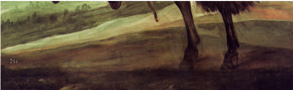
Imagen 1: El príncipe Baltasar Carlos a caballo. 1634-35. Diego Velázquez

Imatge 1. El príncep Baltasar Carlos a cavall. 1634-35. Diego Velázquez.