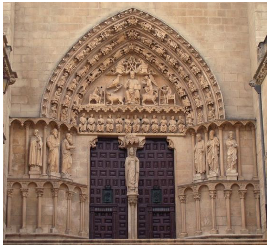
Imagen 2: Pórtico del Sarmental. Catedral de Burgos. Siglo XIII.

Imatge 2: Pòrtic del Sarmental. Catedral de Burgos. Segle XIII.